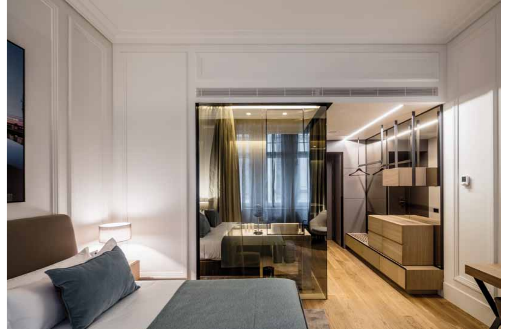
Hotel BoHo en Praga / Hotel BoHo in Prague